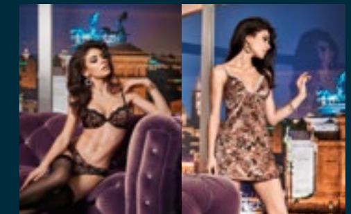
65 - IMPERO / ESOTICO 66 - REGNO