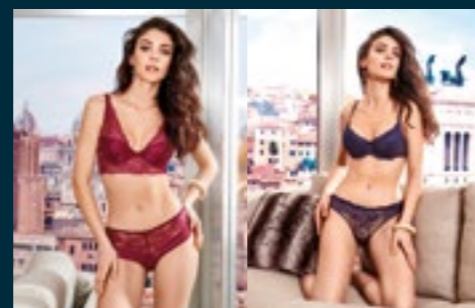
15 - MAGICA / SFARZOSO