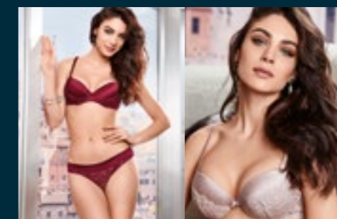
33 - DESERTO / DESERTO