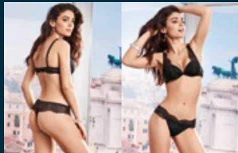
42 - ASPIDE / ASPIDE