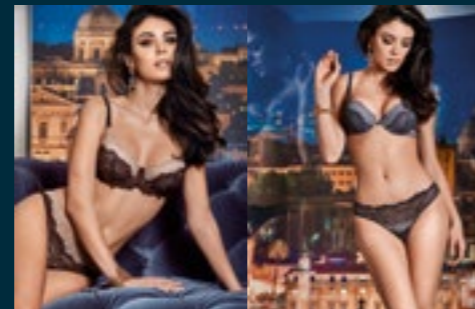
49 - SIMBOLO / SIMBOLO 50 - LOOK / LOOK