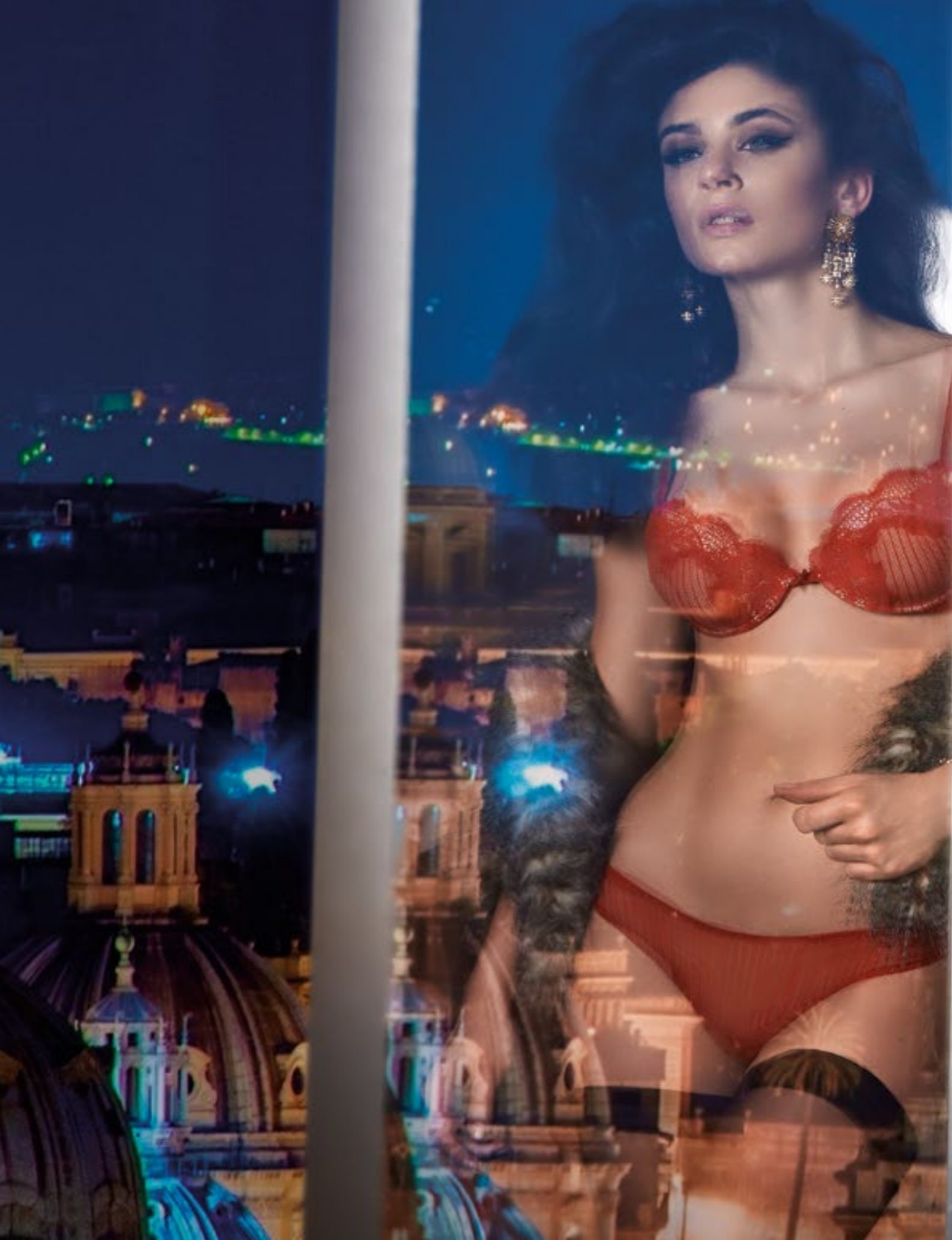
REGGISENO push up in tulle gessato e pizzo, coppe push up invisibili Moulded graded padded pinstriped tulle and lace push up BRA TAGLIE/SIZES: I/V