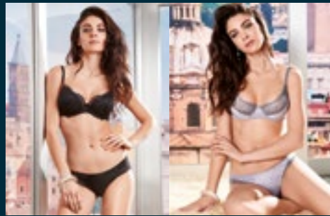
37 - IGUANA / IGUANA 38 - RETTILE / IGUANA

PETRUS, GRIGIO FUMO, NERO, RUBINO-NERO PETRUS, SMOKE GRAY, BLACK, RUBY-BLACK