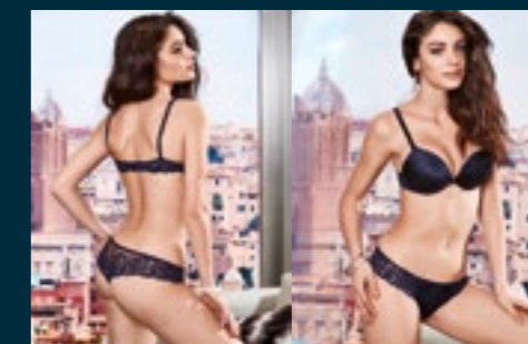
32 - DUNA / OASI

ROSA BATIDA, BLU NOTTE, NERO, BORGOGNA BATIDA PINK, NIGHT BLUE, BLACK, BURGUNDY