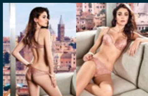
18 - FATATA / FATATA