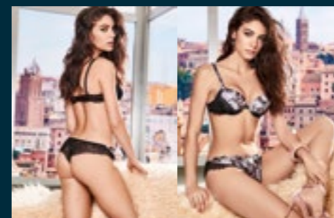
24 - PASSIONE / PASSIONE

ROSA BATIDA, PETRUS, NERO BATIDA PINK, PETRUS BLUE, BLACK