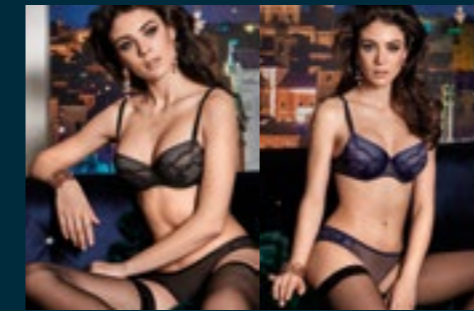
55 - FINE / PREGIATO 56 - PREGIATO / PREGIATO

NERO, BLU NOTTE, CAFFÈ, ROSSO NATALE BLACK, NIGHT BLUE, COFFEE, XMAS RED