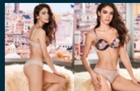
26 - FUOCO / FUOCO