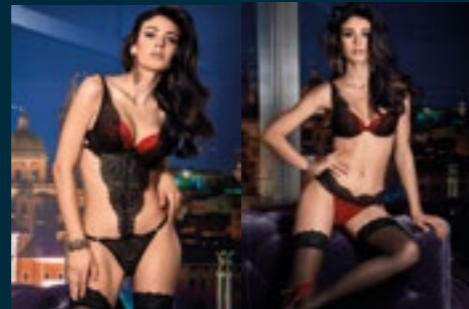
81 - BOA