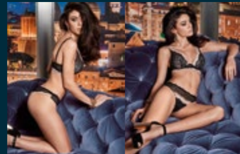
52 - TREND / LOOK