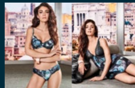
27 - ESTASI / ESTASI