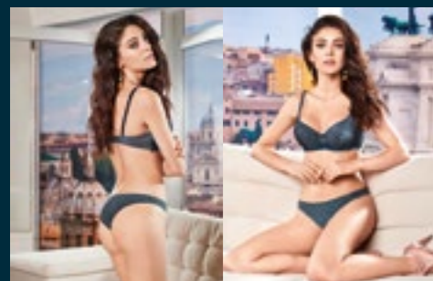
10 - IMPETO / BRIO