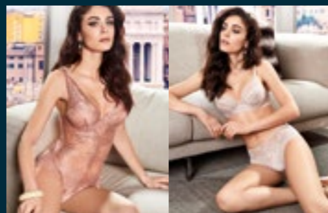
19 - FASTOSA