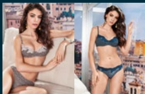
07 - BRIO / GAIA