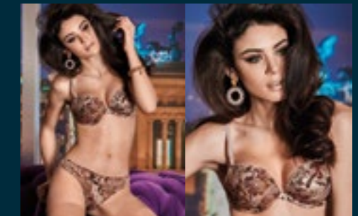
67 - TRONO / IMPERO 68 - TRONO