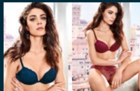
13 - OPULENTA

MAKE UP, COGNAC, BLU NOTTE, BORGOGNA, ROSSO NATALE, PETRUS MAKE UP, COGNAC, NIGHT BLUE, BURGUNDY, XMAS RED, PETRUS BLUE