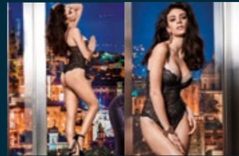
48 - EMBLEMA

NERO-BEIGE, GRAFFITE-FUMO, CAFFÈ-BEIGE BLACK-BEIGE, GRAFFITI-SMOKE, COFFEE-BEIGE