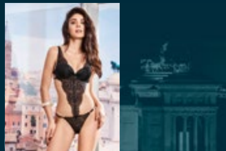
43 - BOA