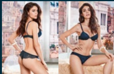
40 - PITONE / PITONE