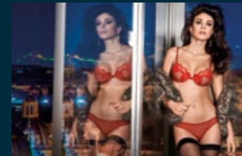
59 - STILOS / STILOS